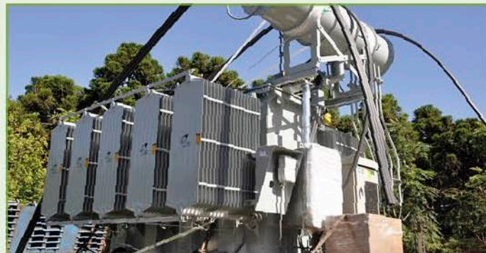
Nuevo transformador de la Estación Transformadora Flandria