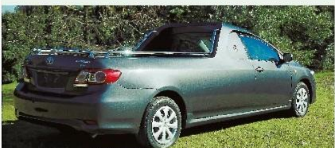
Nuevo coche porta coronas.

Los autos han sido transformados en un taller especializado de la zona para lograr su adaptación como porta coronas en un caso, y como coche fúnebre en el otro.