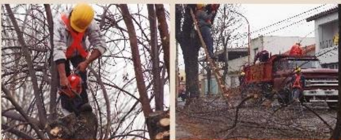
Imágenes de la poda 2012 que también se hizo en conjunto entre Cooperativa y Municipalidad.

La Municipalidad de Luján y la Cooperativa Eléctrica con la colaboración de las empresas TeleRed y Cablevisión; continúan de forma conjunta con el Plan de Poda Urbana en el Partido de Luján que se inició en el mes de junio y durará hasta agosto.