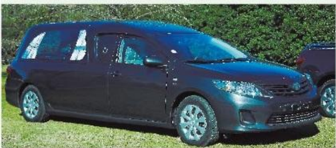
Nuevo coche fúnebre.

Se trata de dos automóviles marca Toyota modelo Corolla, adquiridos mediante un contrato de leasing celebrado con el Banco Credicoop Coop. Ltda. mediante una inversión total de $ 330.000.