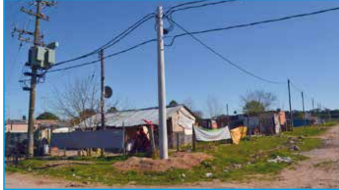
Localidad de Luján, Barrio San Pedro, Calle Los Rosales y Las Camelias.

Redistribución de Potencia. Se extendió sobre la calle Echeverría desde Chubut hasta Córdoba una línea en Media Tensión de aprox. 500 mts en 13,2 KV, más un nuevo puesto de transformación de 315 KVA. con un tendido de línea en Baja Tensión con cable preensamblado de 120mm 2 . Cumpliendo esta obra la primer etapa de refuerzo integral, proyectado para todo el Barrio Lucchetti.