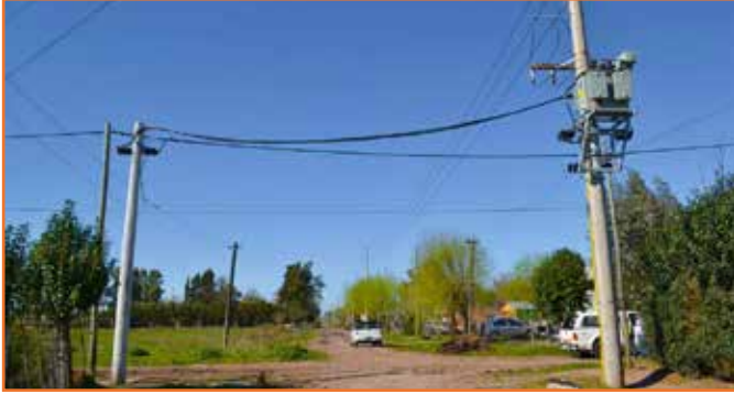
Localidad de Open Door, Barrio Lucchetti, Calle Córdoba esq. Echeverría

Redistribución de Potencia. Se extendió sobre la calle Echeverría desde Chubut hasta Córdoba una línea en Media Tensión de aprox. 500 mts en 13,2 KV, más un nuevo puesto de transformación de 315 KVA. con un tendido de línea en Baja Tensión con cable preensamblado de 120mm 2 . Cumpliendo esta obra la primer etapa de refuerzo integral, proyectado para todo el Barrio Lucchetti.