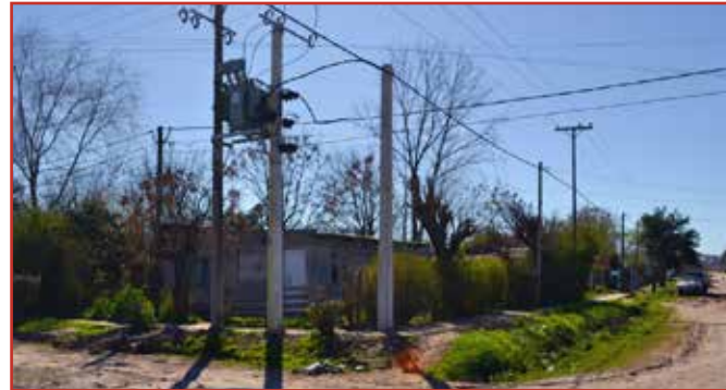
Localidad de Luján, Barrio Ameghino, calle Darwin esq. Ameghino.

Instalación de un Nuevo Puesto de Transformación de 315 KVA, más el tendido de 300 metros de cable preensamblado de 120 mm 2 , beneficiando a toda la zona.