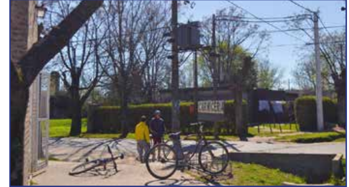
En la localidad de Luján, Bo. San Pedro, Calle el Irupé e/ las Margaritas hasta Palo Borracho y sobre Palo borracho desde Irupé a las Azaleas

Ampliación de Potencia de 160 KVA a 315 KVA, más refuerzo de Línea en Media Tensión, Tendido de 500 metros de cable preensamblado de 120 mm 2 y parte de 50mm 2 . Reporta beneficio directo hacia toda la zona del Barrio San Pedro.