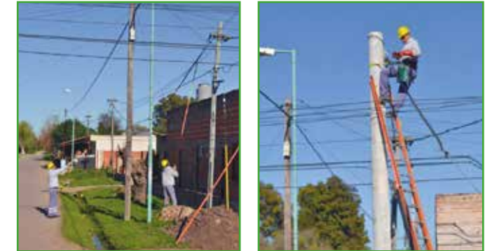
En la Localidad de Pueblo Nuevo, en calle Pasteur e/ Tropero Moreira y el Campo

Instalación de un Nuevo Puesto de Transformación de 315 KVA, más el tendido de 300 metros de cable preensamblado de 120 mm 2 , beneficiando a toda la zona.